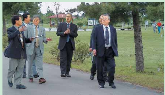
パークゴルフの説明を受ける本吉町議会議員