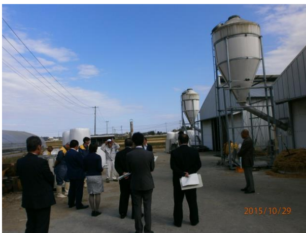
現地説明((株)桜井アグリサービス)

南相馬市は、震災(津波)や原発事故(放射能)の被害が大きかったが、特に風評被害による影響が未だ続いており、復興を妨げている。各地点に放射能測定が設置されているが、原発から遠く離れた県で南相馬市(低値)よりも高値になったこともあり、風が影響しているのではないかとのこと。また、降雪によって低値になる。今後、風評被害を払拭することが課題であり、国民が被災地で生産されたものを積極的に購入して応援し、復興が加速していくことを願ってやまない。