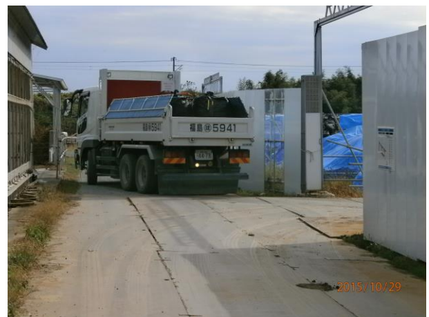
農業用水路除染汚泥の仮置場