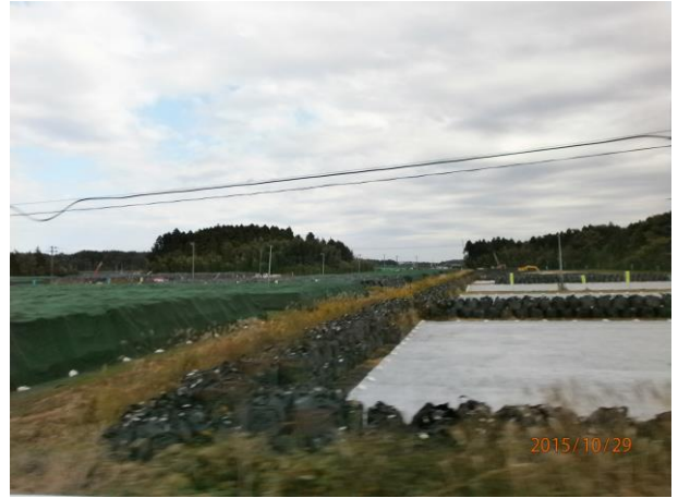
除染された仮置場