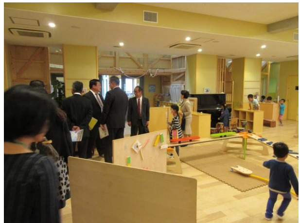
自由なスペースにあふれた園内の様子