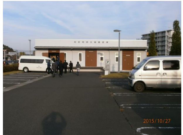
防災備蓄倉庫(役場横)