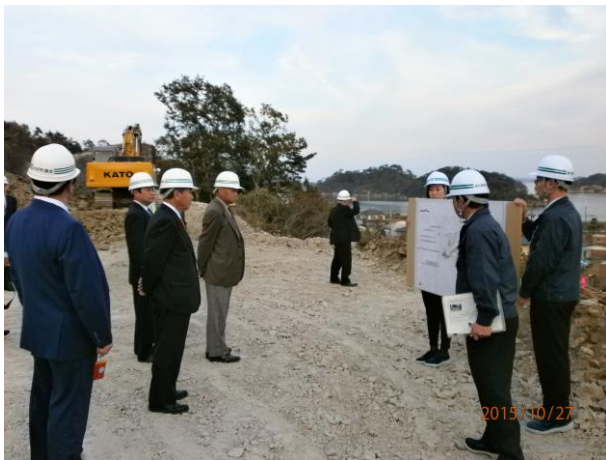
浜田地区避難施設及び防災備蓄倉庫