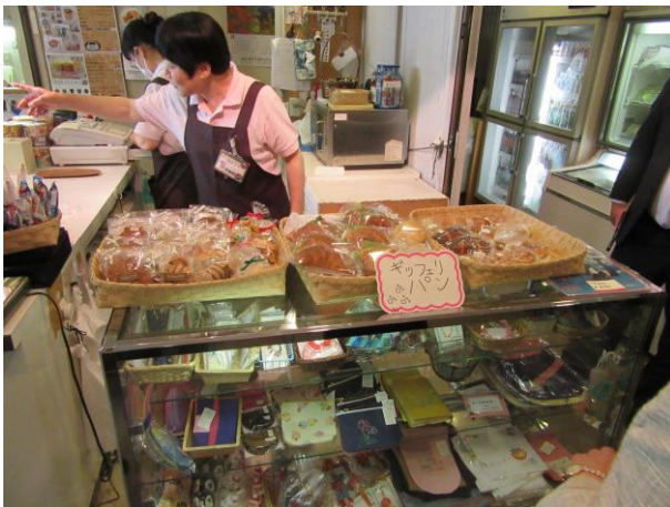
ふれあいショップサンテ

ふれあいショップサンテ視察後、南区社会福祉協議会会議室で昼食をとりながらサンテ店長である支援員の方を中心に話を聞いた。障がい者の方への対応、収益を上げるための労力、現実の難しさを学んだ。サンテでは就労の場であり、次の職業という所につないでいくことの難しさを解決しなければならないと認識を深めた。