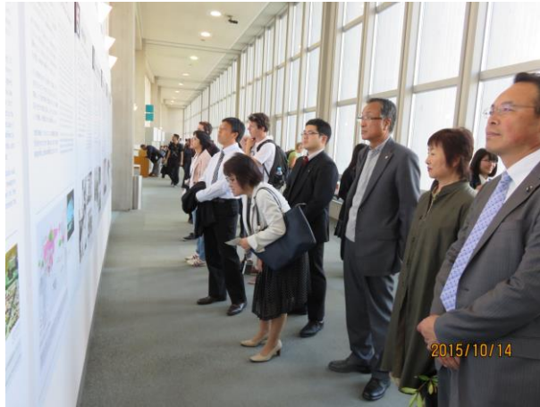
原爆投下の惨状について理解を深める

老朽化している施設の維持管理に疑問が投げかけられているが、可能な限り現状維持されることが望まれる。