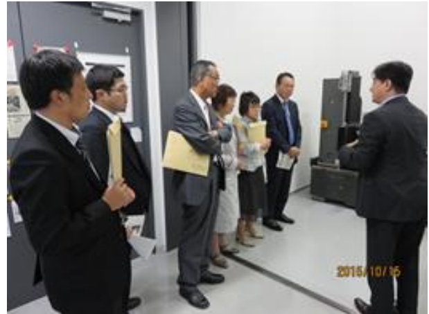
電子機器による分析についての説明