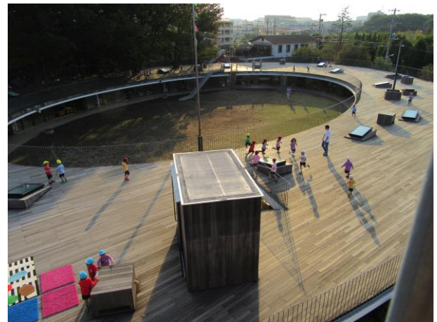
園舎の屋根を元気に走り回る子どもたち