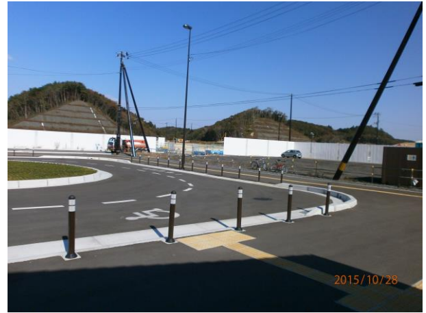
高台地造成(150万 \text{m}^3 山を掘削)