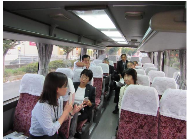
沿岸部の津波の被害地域を視察