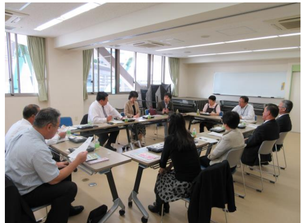
16年勤務している店長より説明を受ける