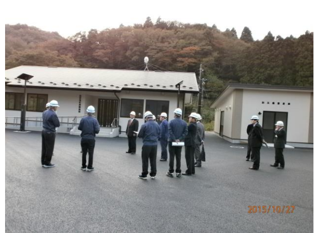
須賀地区避難道路整備