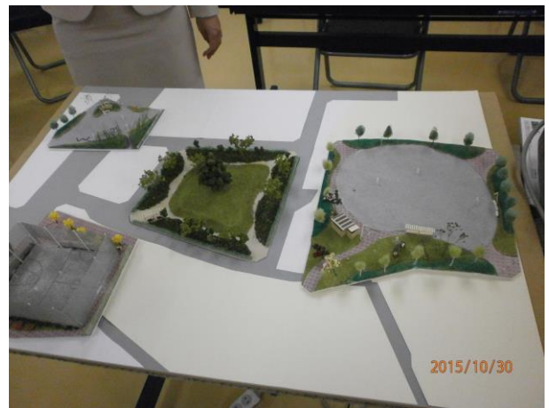
「ちびっこ公園」模型