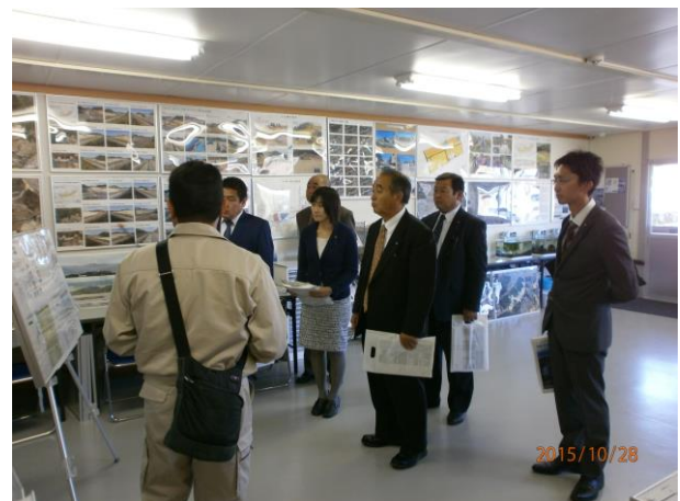
高台地造成整備の説明