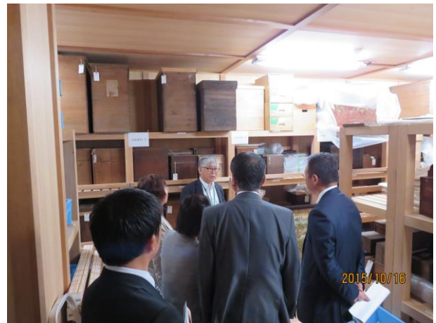
収蔵庫の管理についての説明