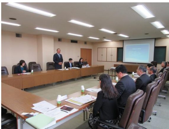
原島議長から説明を受ける

住民に対しシステムの存在を認識させることや高齢者人口1%の介護ボランティアの必要性を認識した。