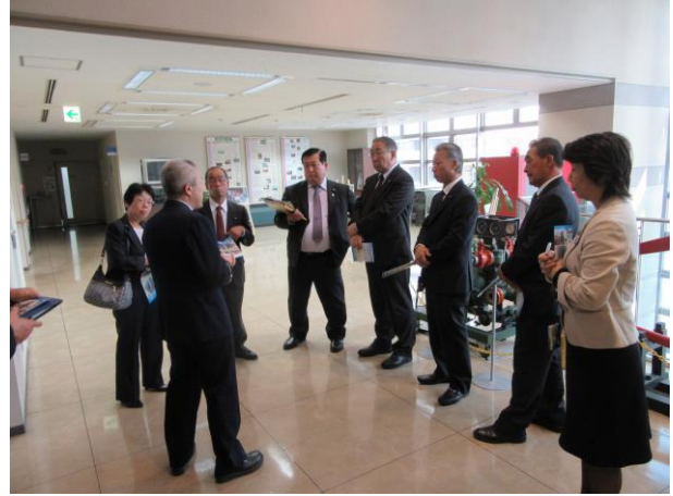
郡山地方広域消防組合