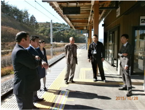
移転された東名駅